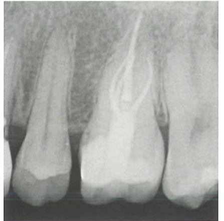
根管充填後のレントゲン写真