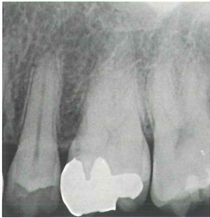
カリエス治療後に長期間冷水痛があり、症状悪化のため抜髄となった。