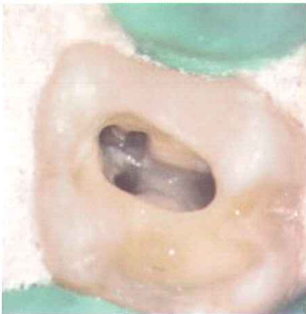
根管形成終了後の根管口部