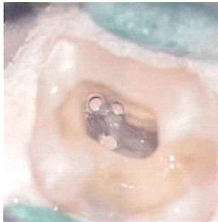
根管充填後の根管口部