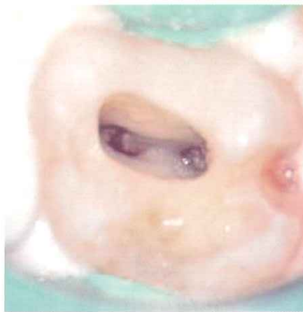
アクセスすると、髄腔が狭窄して根管口部が確認し難いことがわかる。