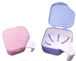
種類:ピンク・ブルー