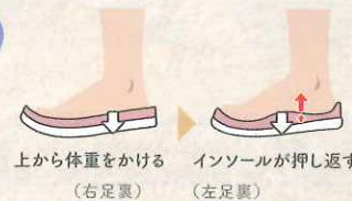
上から体重をかける インソールが押し返す (右足裏) (左足裏)

外側のクッション性に対し、インソールを硬く設定し、その硬度差から押し返す力が生まれ、指圧効果を得ることができます。また、歩行により更なる効果が期待できます。