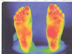
天空を1時間履いた後

地方独立行政法人 大阪産業技術研究所 に於いての サーモグラフィ試験 (被験者：二十代女性)