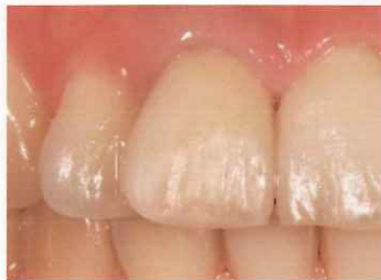
ツヤを失った補綴・修復物