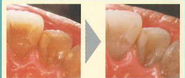
軽度のステインも除去できます