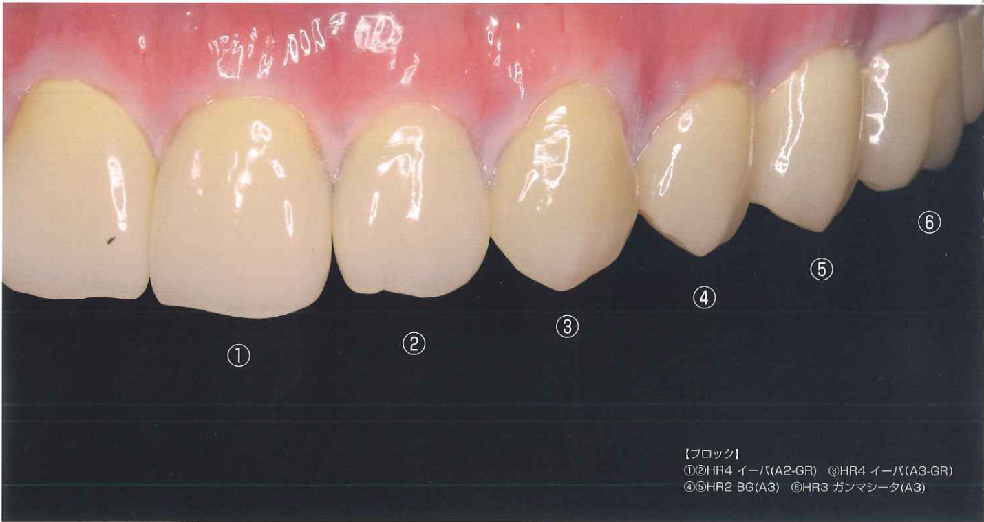
【ブロック】 ①②HR4 イーバ(A2-GR) ③HR4 イーバ(A3-GR) ④⑤HR2 BG(A3) ⑥HR3 ガンマシート(A3)