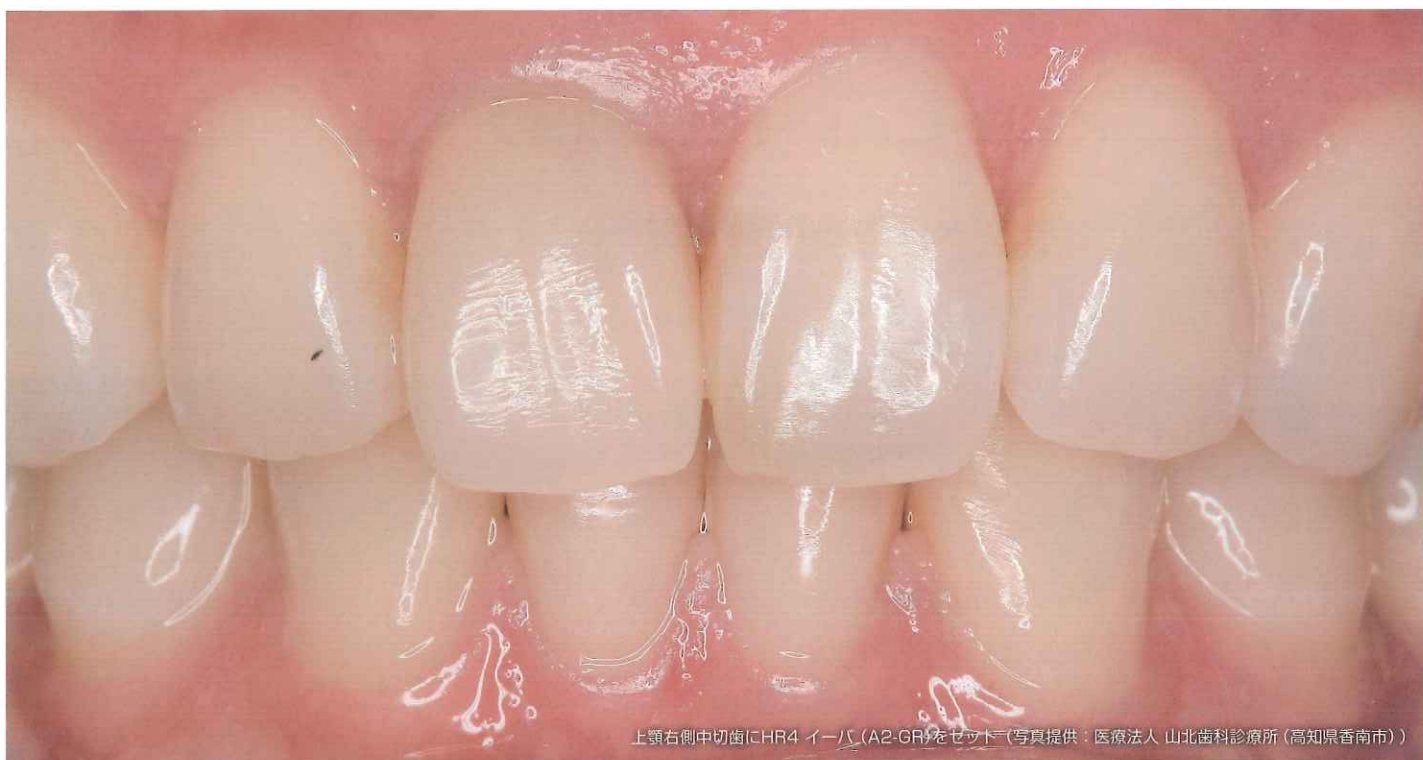
上顎右側中切歯にCHR4 イーバ (A2-GR)をセット