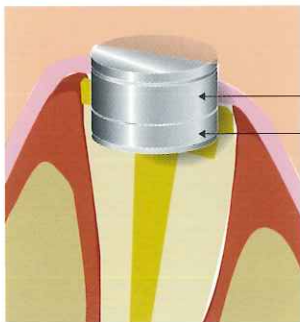
フィジオマグネット フィジオマグネットキーパー

摩耗などの経時的変化やMRI検査などでキーパーの撤去が必要な場合には、根面板を壊さずに、簡単に取り外すことができます。取り外した後は、新しいキーパーを装着できるため、患者さんの負担を軽減することができます。