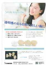
ジルコニア治療案内ポスター (A3サイズ)