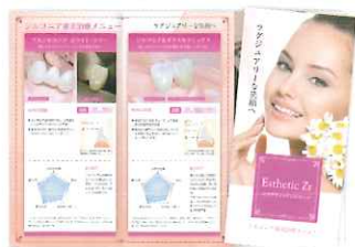
ジルコニア治療案内リーフレット

ご注文はお電話 (フリーダイヤル) かWebサイトからお申込みいただけます。送料含め、無料でご提供しております。