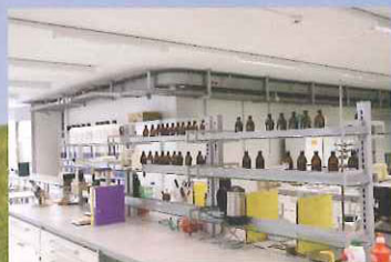
品質管理と開発専用の施設