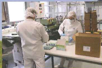
徹底した衛生管理のもと 1 つ 1 つ検品