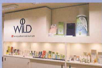
Dr.Wild は口腔ケアに特化したスイスの製薬会社

ジェルタイプは、ビタミン A,B,C,E を豊富に含んでいるとされているオレンジ果皮油 (保湿剤) などの天然成分が配合された自然派の歯磨剤であり、防腐剤や研磨剤が含まれていないため、口腔粘膜や歯面に化学物質が及ぼす影響を気にされる方にも、自信をもっておすすめいたします。