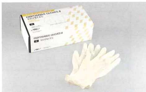
ディスポーザブル手袋(ラテックス製・未滅菌)