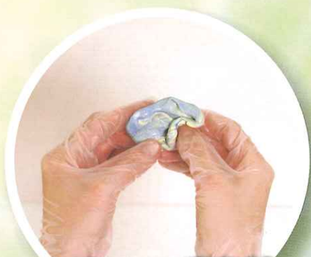
シリコン印象材 パテタイプのねつ和