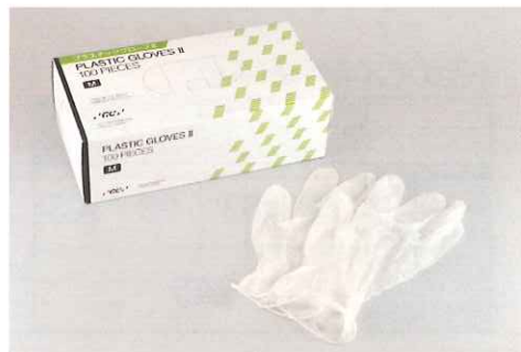
ディスポーザブル手袋(プラスチック製・未滅菌)