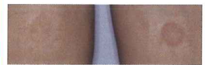
(AHA: フルーツ酸と言われる刺激物質)