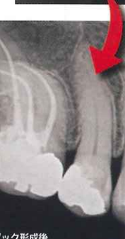
パシロジック形成後