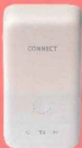
コネクトセルラー