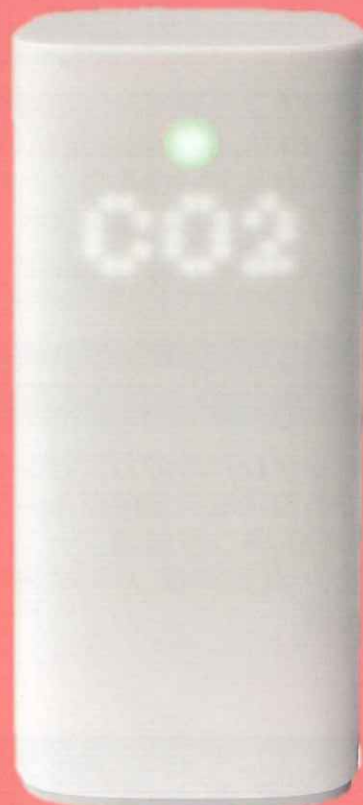
コネクトCO 2 センサ (実寸大)