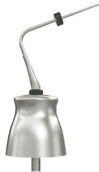
スモール (Black) φ 0.4mm/2.5% テーパー