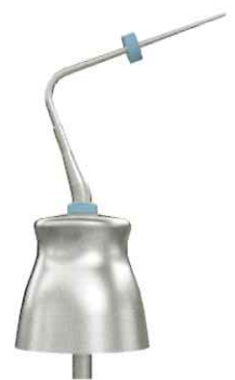
ラージ (Blue) φ 0.6mm/6% テーパー