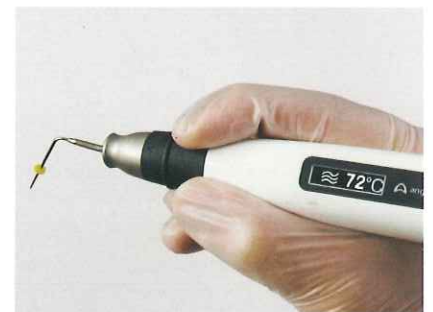
約 2 秒のクイッククーリング

メインスイッチがリング状で 360° 操作が可能のため、様々な角度から の診療が容易です。