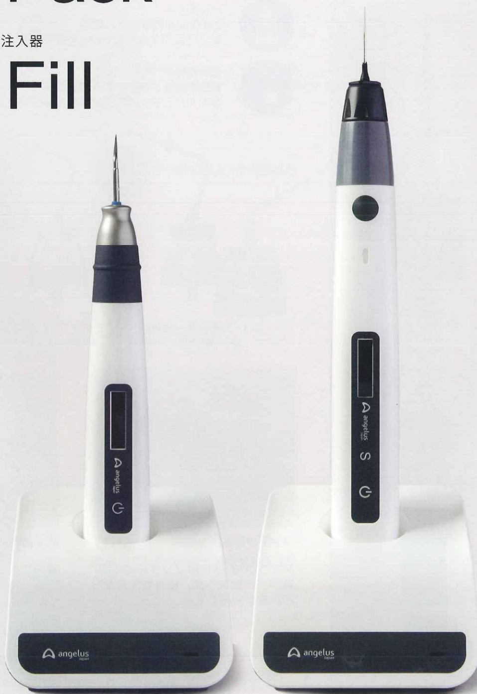
電熱式根管プラグ プレジジョン Fast Pack