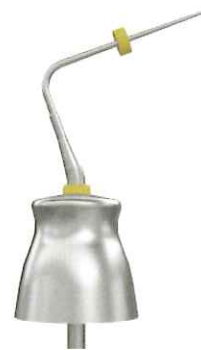
ミディアム (Yellow) φ 0.5mm/5% テーパー