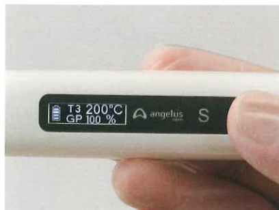
ディスプレイで簡単確認