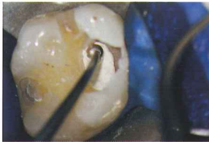
バイオ シー リペア を露髄面を刺激しない ように圧接。