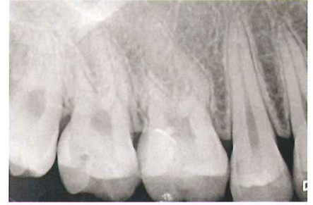
術後のデンタル X 線写真。