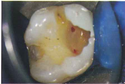
軟化象牙質を除去したところ露髄を確認。