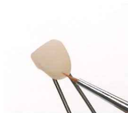
キャラクタライズ