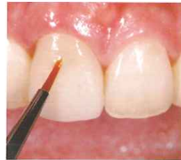
キャラクタライズ