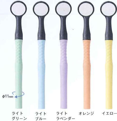
ライトグリーン ライトブルー ライトラベンダー オレンジ イエロー