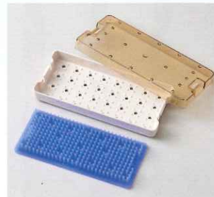
各ケースには専用のシリコンマットが1枚付属。