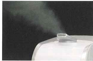
霧が良く飛ぶ吹出口

電源ONですぐに霧が発生し、効率よく次亜塩素酸ナトリウムを放出、室内の除菌・消臭ができます。また 噴霧する霧は熱くない のでお子様やお年寄りがうっかり触ってしまってもヤケドの心配がなく、どなたにも安心してお使いいただけます。