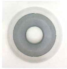
特殊加工超音波振動子

※お客様にて部品の交換はできません。お買い求めの販売店までご相談ください。(有料)