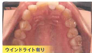
ウインドライト有り