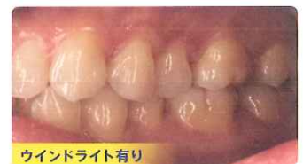
ウインドライト有り