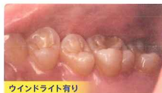
ウインドライト有り