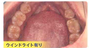
ウインドライト有り