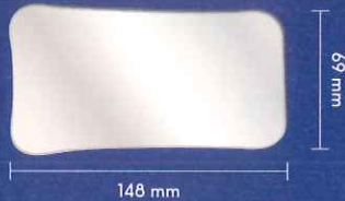
ウインドライトミラー咬合面用 厚さ1mm