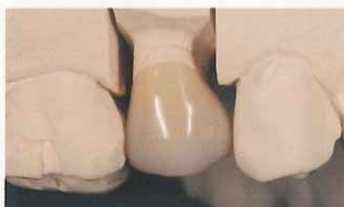
技工物の完成 内面へのサンドブラスト処理