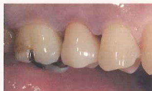
レジンセメントを用いて装着