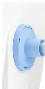
吸引力を7段階で調節可能

強力な吸引力で歯科技工粉じんをしっかり集じんします。吸引力が強いので同時に2ヶ所での運用も可能です。本体サイズが非常にコンパクトで、技工所の環境に合わせて机や作業台の周りに設置しても邪魔にならず置き場所を選びません。作業機の真ん中に置いて2人で使用したり、一方をミリングマシンに接続するなど、1台で複数の活用方法が考えられます。