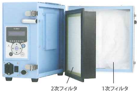
2次フィルタ 1次フィルタ

2つの高性能フィルタを採用し、1次フィルタで大きめの技工粉じんを捕集し、2次フィルタで細かな粉じんもしっかりキャッチします。2つのフィルタからは清浄な空気が排気され、技工所の粉じん問題にも考慮された設計です。