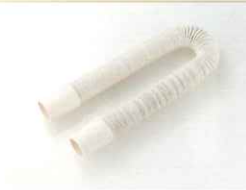
専用ホース (カフス付き)