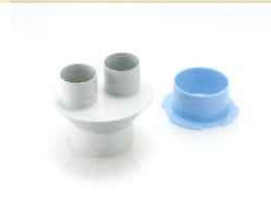
分配器・分配機用アタッチメント