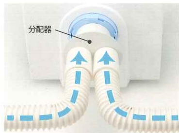
分配器をつけることで2ヶ所同時に吸引できます