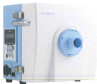
歯科技工用集塵機 スマートレーサ プレミアム

デモ機貸出 デモ機の貸出を受けておりますので下記番号までお問い合わせください。 TEL: 072-570-5708