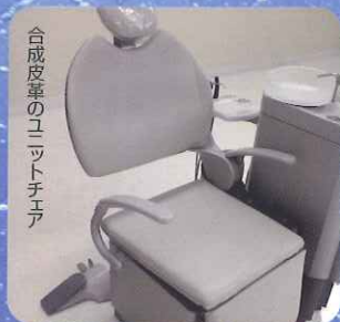
合成皮革のユニットチェア