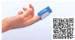
SpO 2 測定用プローブ リユーズブルタイプ