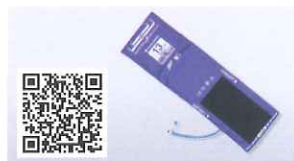
非観血血圧測定用カフ リユーズブルタイプ