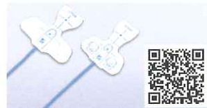
SpO 2 測定用プローブ ディスポーザブルタイプ