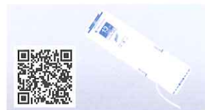
非観血血圧測定用カフ ディスポーザブルタイプ