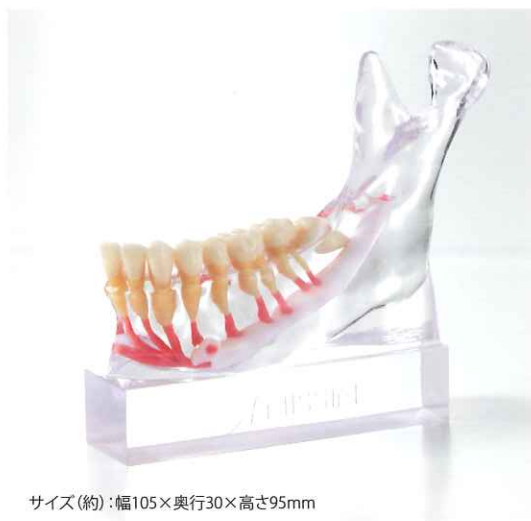
サイズ(約):幅105×奥行30×高さ95mm