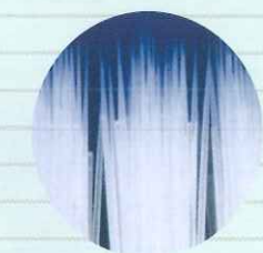
PBT(ポリブチレンテレフタレート)