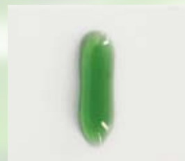
視認性に優れた ダークグリーンジェル