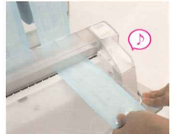
緑のランプが点灯してピープ音が鳴ったら、シールが完了です。