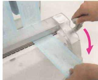
滅菌パックを引き出してレバーを倒します。