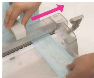
カッターをスライドさせて滅菌パックを切ります。滅菌パックの反対側もシールします。