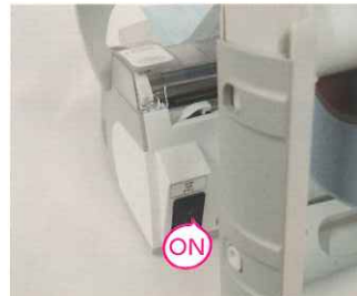
裏面のスイッチを押して、電源を入れます。