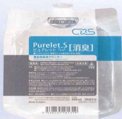
ピュアレットSパウチ消臭 ＜消臭剤配合タイプ＞ 300mL 定価1,900円(税別)