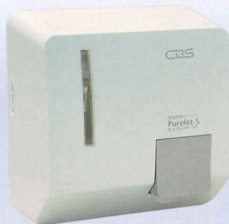
ディスペンサー：ホワイト 定価4,005円(税別)