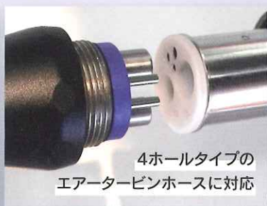
4ホールタイプの エアタービンホースに対応