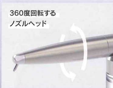
360度回転する ノズルヘッド