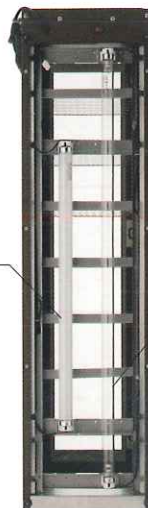
照明用青色蛍光灯 20W×1本 (型番: FL20WB)