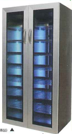
左取っ手仕様 (特注品は+4,000円)