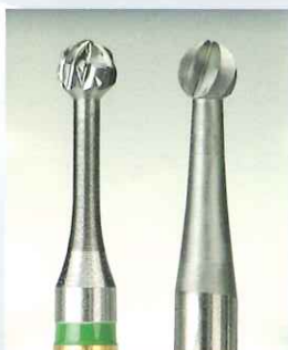
H1SEMと通常のスチールバー