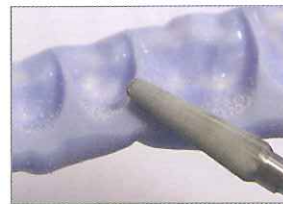
切削バーによるトリミング