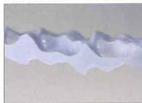
ナイフによるトリミング