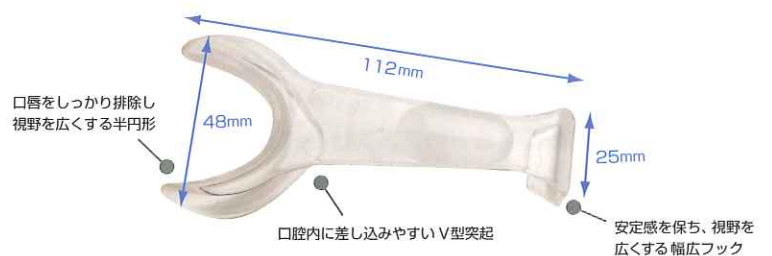
Wリトラクター 材質：ポリメチルペンテン樹脂 販売単位：1袋/2個入 一般医療機器 日本製 届出番号 11B3X10020000001