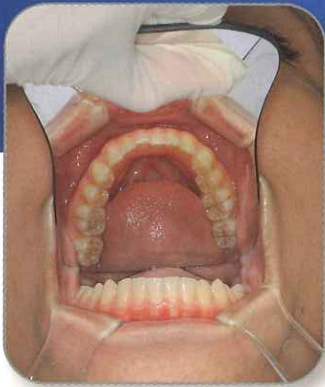
エバポーレイテッドミラー 材質：ガラス製（表面 ロジウムメッキ） 販売単位：1枚 一般医療機器 アメリカ製 届出番号 27B2X00041000004