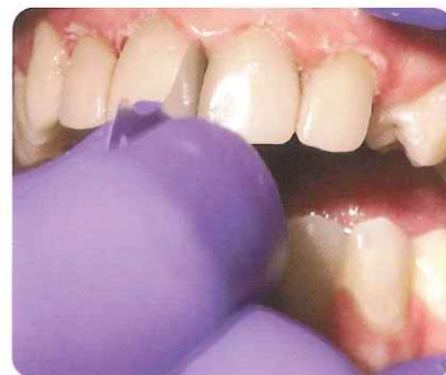
③同様の動きで適度な圧を加えながら タイトな硬化セメントなど余剰材を取り除きます。