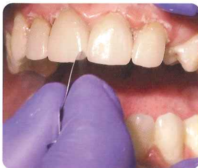
②ロッキングモーションでプロキシディスクを 隣接面コンタクトに挿入します。