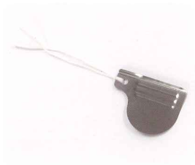
①把持部の穴にフロスを通し結び、 口腔内での落下等のリスクに備えます。