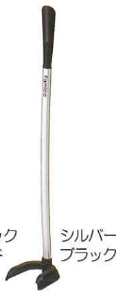
シルバー ブラック