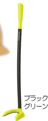
ブラック グリーン