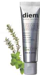
ボタニカル トゥースペースト