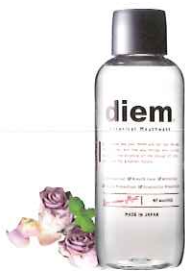
ボタニカル マウスウォッシュ