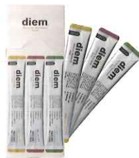
ボタニカル マウスウォッシュスティック

限定フレーバー ライムベルガモットアロマ・ミント ジンジャーアロマ・ミント ローズアロマ・ミント