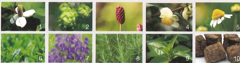
<画像左から> 1.ドクダミエキス 2.ホップエキス 3.フレモコウエキス 4.ウーロン茶エキス 5.カモミラエキス 6.茶乾留液 7.オウゴンエキス 8.ローズマリーエキス 9.セイヨウハッカエキス 10.アセンヤクエキス ※1全て保湿成分

厳しい環境で育った植物の力が、ぎゅっと詰まった美容エキス。口内を潤いでコーティングするようにみずみずしく保ち、気になるネバつき・パサつきや口臭を予防します。