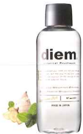
ボタニカル マウスウォッシュ