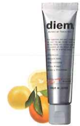
ボタニカル トゥースジェル