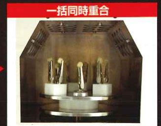
照射室内にターンテーブルをセット 仮重合 15秒 最終重合 120秒