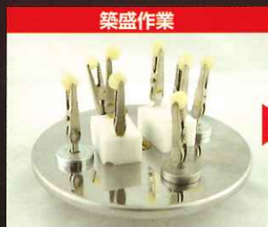
築盛作業終了順にマグネットスタンドをターンテーブルに並べます。

高さ調整が可能な2段の脱着式ターンテーブル採用で大型の補綴物を庫外で簡単にセットできます。セット後は照射室にターンテーブルを置くだけ。12cmのワイドテーブルで大量の補綴物を一括同時重合でき、大幅な作業時間の短縮を可能にしました。