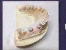
スキャニングスプレー後