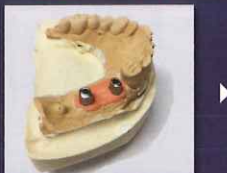
スキャニングスプレー前