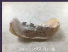
スキャニングスプレー後