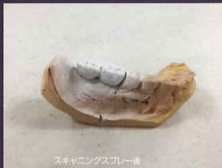
スキャニングスプレー後