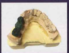
スキャニングスプレー前