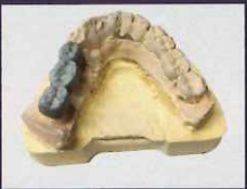
スキャニングスプレー後