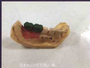
スキャニングスプレー前