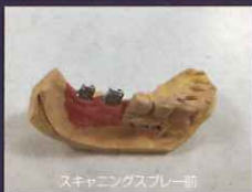
スキャニングスプレー前