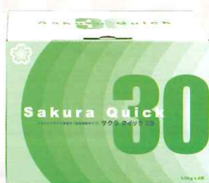
■包装形態 6kg箱 (1.5kgアルミ袋×4)