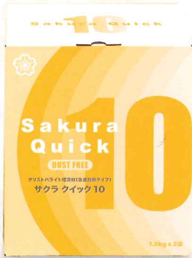
■包装形態 3kg箱 (1.5kgアルミ袋×2)

一般医療機器 歯科材料8 歯科用石膏及び石膏製品 JMDN70900010 歯科鑄造用石膏系埋没材 届出番号: 13B2X10233000055(サクラクイック10), 13B2X10233000023(サクラクイック20/30)