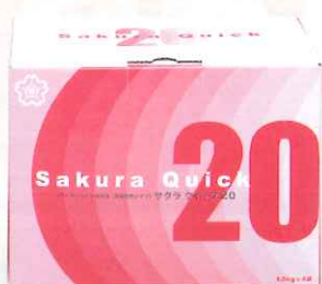
■包装形態 6kg箱 (1.5kgアルミ袋×4)