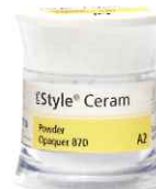
IPS スタイル セラム Powder オペーカー

870°Cで焼成する Powder オペーカーは、短時間での焼成が可能です。高密度に含有するオキシアパタイトで効率的に金属色を遮蔽します。