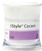
IPS スタイル セラム One

たった一層で最終デザインまで。少量の補足築盛とIPS イボカラーによるステイン焼成で仕上げます。