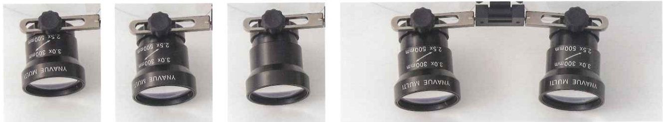
0回転 1回転 1.5回転 2回転