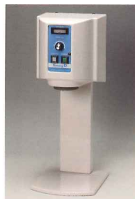
スタンド式(オプション)