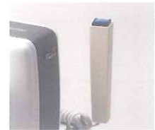
ハンドスイッチ付き