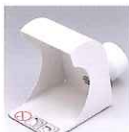
レースカバーDCH-1 標準価格 ¥7,700