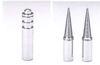
ホイールチャック