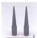
左タケノコ/右タケノコ 標準価格 ¥2,600

作業スペースを取らないコンパクトタイプ ポリュームスイッチで変速可能な高性能ミニレース 標準価格 ¥43,000