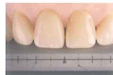
正面観歯冠幅径(実線) 歯軸傾斜(破線)