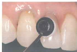
オプトラスカルプトパッドで成形