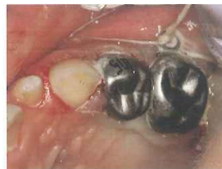
8. 取り外した後の表面をシリコンポイントで研磨する