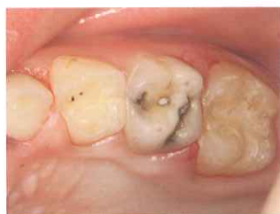
1. 上顎左側 第一、第二乳臼歯の症例