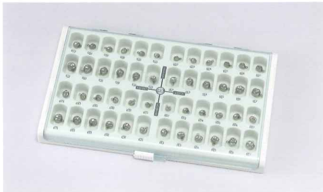
キッズクラウン イントロキット48入 withリング 標準価格 27,000円 206240006 リング無し 標準価格 18,000円 206240001