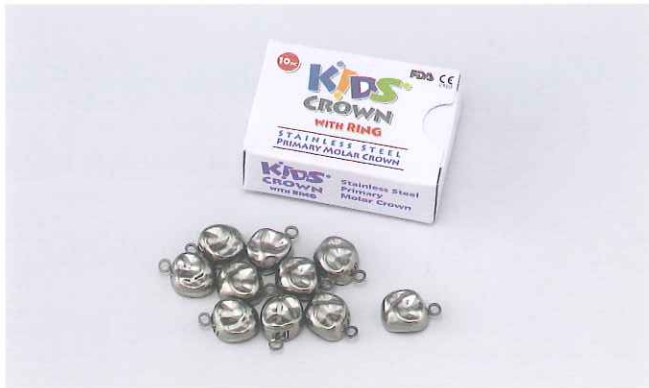
キッズクラウン 単品10入 withリング 標準価格 6,000円 206240007~10 リング無し 標準価格 4,000円 206240002~5