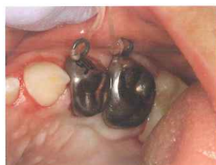
5. 対合歯との咬合を確認する