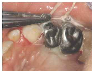
7. フロスとリングをホープライヤーでつかみ、上方向にねじり取る