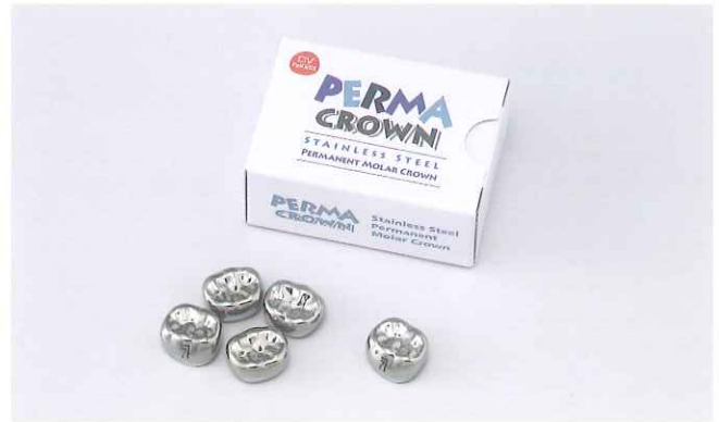
パーマクラウン 単品5入 標準価格 2,000円 206240012~15