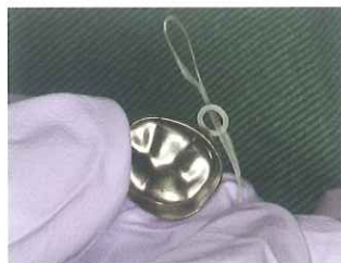
3. 乳歯冠のリングにフロスを通して結ぶ