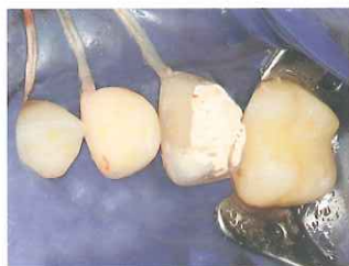
2. 支台歯形成を行う