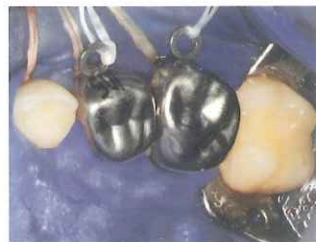
4. フロスを結んだ乳歯冠を試適する