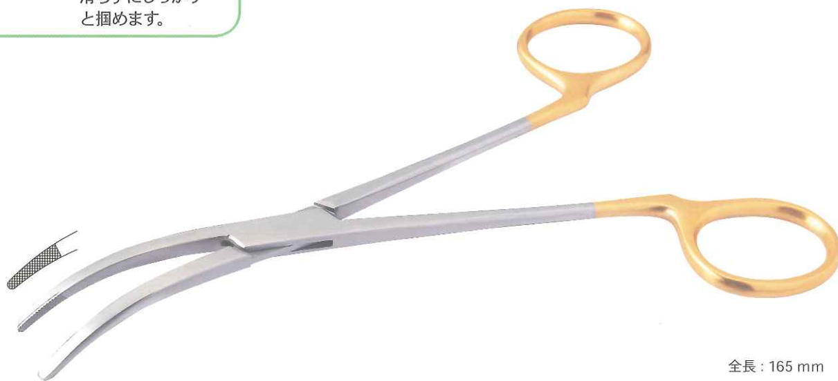
全長 : 165 mm