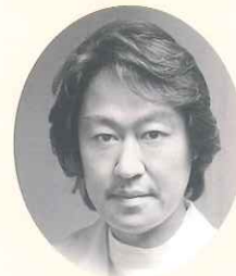
考案者 宮崎真至教授 (日本大学歯学部 保存修復学講座)