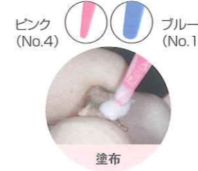
ピンクのプラスチックヘラ (No.4) は、インレー、クラウン、コアなどへ適量のペーストを塗布しやすい先端形状です。