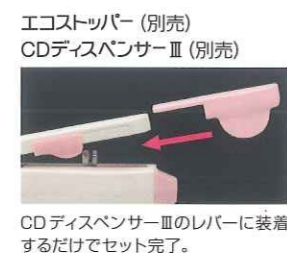
エコSTOPPER (別売) CDディスペンサーⅢ (別売) CDディスペンサーⅢのレバーに装着するだけでセット完了。

エコSTOPPERを用いることで、1クリックでインレー、2クリックでクラウンの適量 (目安) が採取可能。誰でも簡便・正確な計量操作で、より経済的に使用できます。