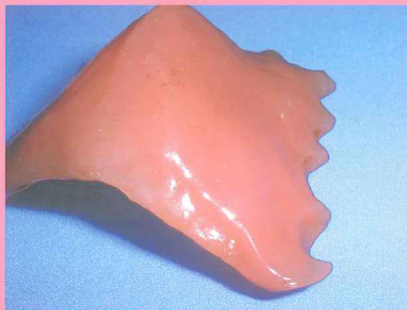
クリーンソフトを使用して3ヶ月間装着