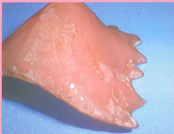
水洗いのみで3ヶ月間装着